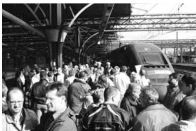
ON PREND LE THALYS POUR ... LA BONNE CAUSE

Le 28 septembre, nous avons organisé, à Bruxelles-Midi, une action d'avertissement en faveur du personnel de nettoyage de cette gare menacé de voir ses activités externalisées.