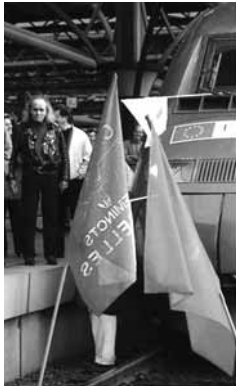
IL NE MANQUAIT QUE LE PRINCE LAURENT ...